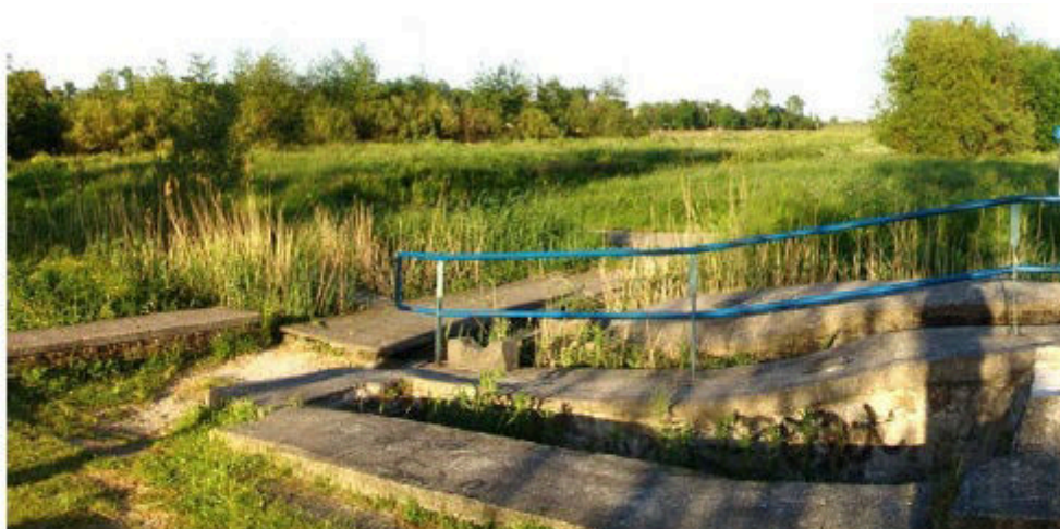
Essemolen met niet alleen het hek, maar ook nog de toegangsvlonder als recreatieve voorziening van de landinrichting uit 1994, toevertrouwd aan recreatieschap Hitland! (Zie p. 8.) Sinds kort ligt er trouwens één vervangende biels.