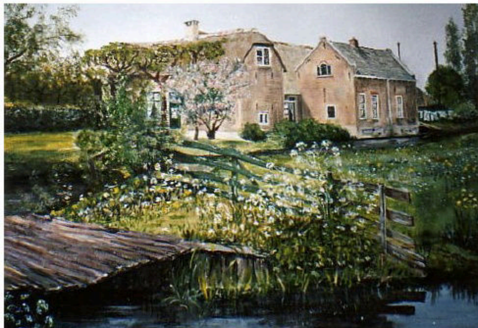
W.s. 18 de -eeuwse Rijksmonument 'Langehof', 's-Gravenweg 16, eind 20 ste eeuw ( www.atelier-mimischouten.nl )

Open middagen Oudheidkamer (14-17 uur): 7/5, 4/6, 2/7 (10-17 UUR), 6/8, 3/9, 10/9 (OMD), 1/10, 5/11, 3/12